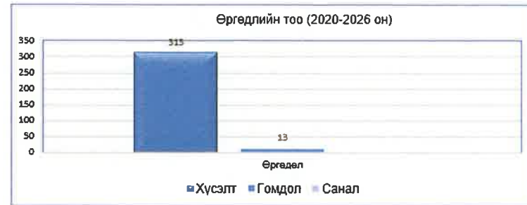
7 жилээр ирсэн өргөдлийн тоон мэдээг харуулбал:

Тайлант 7 жилийн хугацаанд 313 хүсэлт, 13 гомдол, 3 санал ирсэн байна.